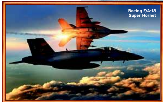
Boeing F/A-18 Super Hornet