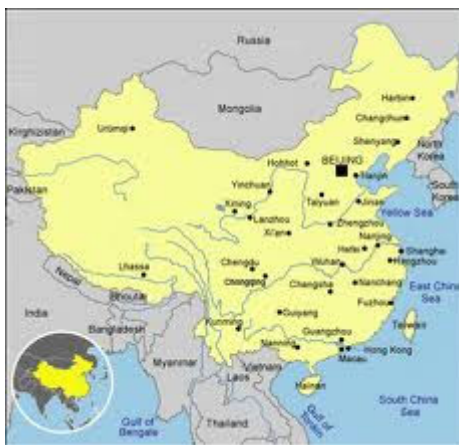
A China e os seus vizinhos no leste asiático.

O elemento que seduz, na China contemporânea é, certamente, o fabuloso desenvolvimento econômico, que age como uma espécie de chamariz para a modalidade de capitalismo “Rio Amarelo”. As características dele quebram todas as expectativas estatísticas. Como frisa conhecido estudioso: “A escala da China é impressionante; é quase impossível, para nós, entender suas estatísticas vitais. Com um habitante a cada cinco do globo, a entrada da China no mercado mundial, quase dobrou a força de trabalho global. Metade das roupas e calçados do mundo já têm uma etiqueta onde se lê Made in China ; e a China produz mais computadores do que qualquer outro lugar do planeta. O apetite voraz da China por recursos está devorando 40% do cimento do mundo, 40% do carvão, 30% do aço e 12% de energia. A China está tão integrada na economia global que seus prospectos têm impactos imediatos em nossas vidas diárias: ao mesmo tempo em que dobra o preço do petróleo e corta pela metade o custo dos nossos computadores, mantém a economia dos EUA em circulação, mas afunda a indústria calçadista da Itália” [Leonard, 2008: 18].