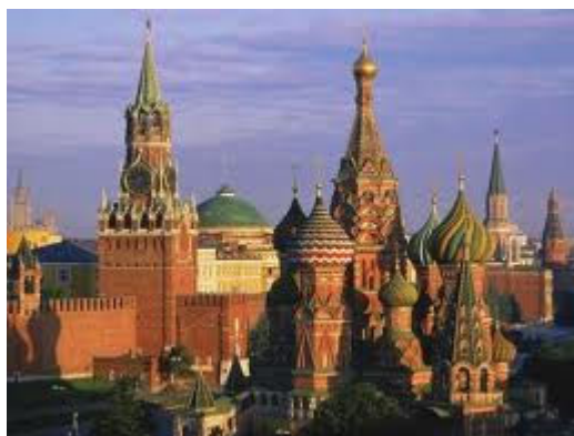
Catedral de São Basílio - Moscou

O bárbaro assassinato, em Moscou, em outubro de 2006, da jornalista Ana Politkovskaya, deixou claro que a liberdade de imprensa, na Rússia, está seriamente ameaçada pelo Estado autoritário [cf. Politkovskaya, 2007]. O processo de democratização do país sofre com a estrutura do poder ferreamente controlada pela burocracia, centralizada ao redor dos organismos de segurança, cujo chefe continua sendo o ex-presidente (e agora primeiro ministro) Vladimir Putin. Trata-se de um contexto político que é, sem dúvida, patrimonialista. A Rússia, aliás, tinha sido considerada por Max Weber e Karl Wittfogel, no século passado, como paradigma desse tipo de dominação, cuja nota característica consiste em que o poder é exercido, pela elite dominante, como se fosse a sua propriedade familiar [Cf. Weber, 1977: II, 810-847; Wittfogel, 1977: 174].