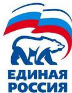
Logo da Federação Russa.