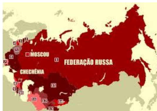
A Federação Russa: país continental.

com que desenvolvam uma complexa política de manutenção dos pactos comerciais com o Ocidente, ao mesmo tempo em que apertam o parafuso da segurança interna e azeitam de novo a máquina de guerra, tudo financiado com os fartos dólares da exploração do gás natural e do petróleo do Mar Cáspio e da Sibéria.