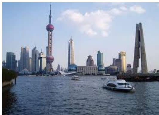
O moderno porto de Shangai.

Por esse motivo, não poderia deixar de iniciar a minha exposição sobre a presença da China no contexto dos BRICS, sem fazer referência ao pano de fundo da milenar história desse povo. O Império Chinês é, certamente, um dos mais antigos e poderosos que conheceu a Humanidade ao longo da sua história. Quatro mil e quinhentos anos, aproximadamente, é a idade da sua saga. Mal poderíamos entender o que se passa hoje na China, sem apreendermos essa rica história, na qual um dos elementos prevaletentes é o cultivo diuturno das ciências a serviço da organização do Estado e da Sociedade.