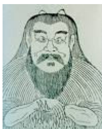
Pan Gu, o “Homem Primordial” do mito cosmogônico chinês.

para o desenvolvimento tecnológico do país. Mas a pesquisa é financiada apenas em parte pelo setor público. Compete à iniciativa privada desenvolver os trabalhos, a fim de manter a competitividade em face das exigências do Estado. A iniciativa privada, estimulada, arca com o ônus da pesquisa. Na China, o financiamento é inteiramente estatal. Conseguirá o regime de Pequim desenvolver o volume de pesquisas em alta tecnologia que o país precisa para superar aos seus competidores ocidentais, notadamente os Estados Unidos? Conseguirão os chineses criar e manter, por longo tempo, um regime adequado de liberdade intelectual, sem o qual as pesquisas não avançam? Por enquanto, em áreas muito sensíveis, ainda eles dependem da tecnologia ocidental.