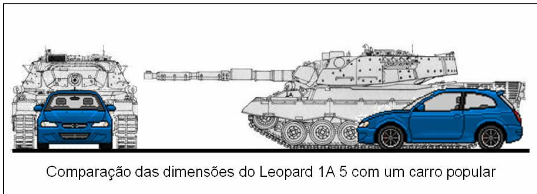
Figura 3 - Dimensões do Leopard comparado a um carro popular

O CC possui uma largura de 3,25m e comprimento 9 de 9,54m (a título de comparação, um carro popular possui dimensões em torno de 1,6m e comprimento de 3,8m, a Figura 14 estabelece uma comparação dessas dimensões). Em função dessas características, o Leopard apresenta restrições à sua mobilidade em ruas estreitas mesmo dispondo do recurso do pivot ou da curva de pequeno raio, pois normalmente a largura das ruas pode variar de 4 a 15 metros 10 . Para minimizar esse efeito é necessário identificar as Via de Acesso (Via A) com esse tipo de restrição e evitar a sua utilização.