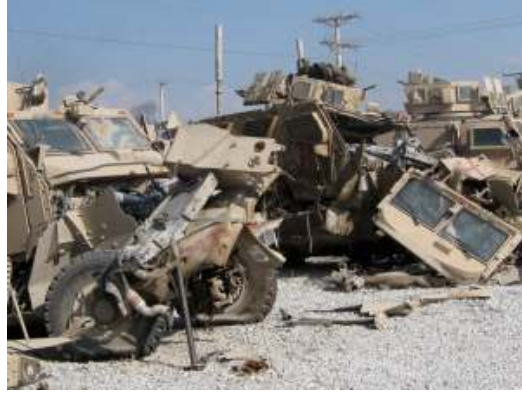
Um típico IED construído com granadas de artilharia. O resultado contra diversos veículos MRAP no Afeganistão. Notar que os compartimentos da tripulação ficaram intactos.

Agora foi a vez dos britânicos apresentarem o que será o substituto de seus Land Rover Defender, um novo conceito de veículo conhecido com a denominação de TMV (Total Mobility Vehicles) que prevê versões 4x4, 6x6 e 8x8, sendo que o modelo apresentado foi a versão 6x6M, um todo terreno modular com tração nas seis rodas, que poderá ter inclusive versão civil.