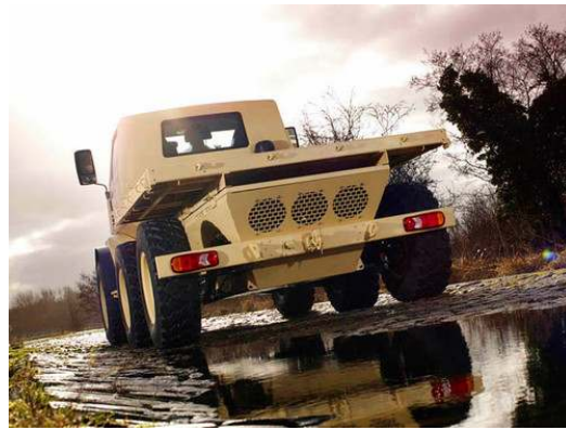
Vistas frontal e traseira do TMV 6x6M. Notar o formato em “V” do chassi e com o este protege toda a parte inferior do veículo que possui um conceito modular.