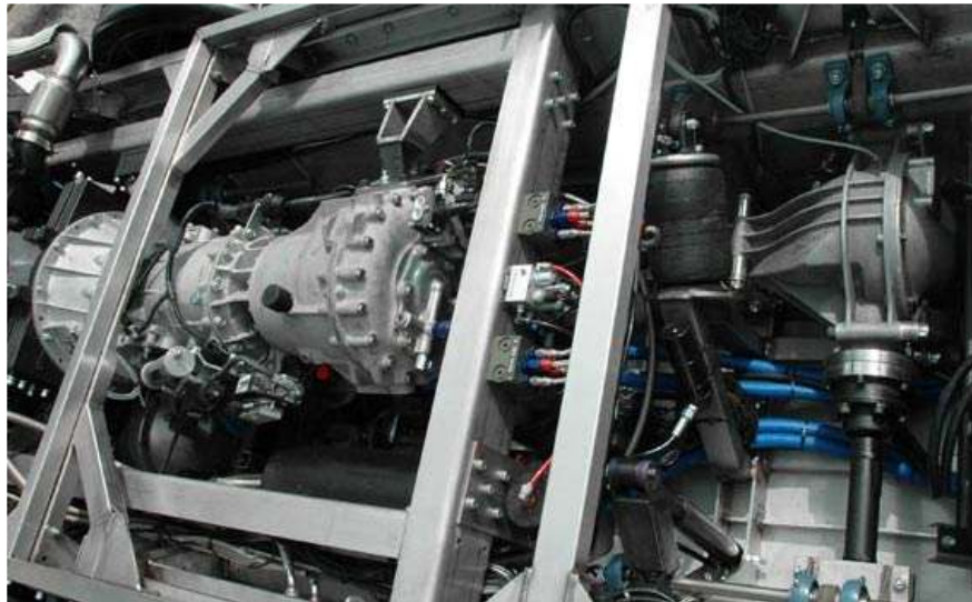
Detalhe dos componentes como caixa de transmissão e diferencial no interior do chassi.

Com 5,7 metros de comprimento, 2,36 metros de largura e 2,23 metros de altura, com peso vazio de 3,5 toneladas, podendo transportar uma carga de até Quatro toneladas, é impulsionado por um motor Cummins Diesel Euro5 de 4,5 litros, turbo, com 220 CV, caixa automática Allison 2500 SP de seis relações com o redutor, e três diferenciais com bloqueadores DANA, com alcance de 1.120 km e velocidade máxima de 137 km/h, com ângulos de entrada e saída de 52° e 50° respectivamente, o que lhe garante uma capacidade off-road muito boa, com freios a disco ventilados Brembo de 300 mm nas seis rodas. Todos os sistemas são controlados eletronicamente a partir de um painel multifunções situado no compartimento do motorista.