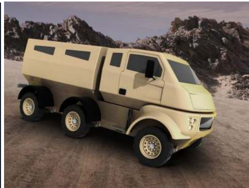
Concepção artística elaborada pelo fabricante das versões 6x6 de carga e transporte de pessoal.

Seu revolucionário conceito consiste de um chassi reforçado em aço inoxidável, fechado, que abriga por completo todos os componentes do veículo, como motor, transmissão, diferenciais e demais componentes, envolvendo-os num formato e “V” que permite espalhar a onda de choque no caso da explosão de uma mina anticarro, por exemplo, ou até um IED, preservando assim a vida da tripulação. Sobre este chassi é montada a estrutura modular blindada, robusta do veículo que pode ter diversas versões