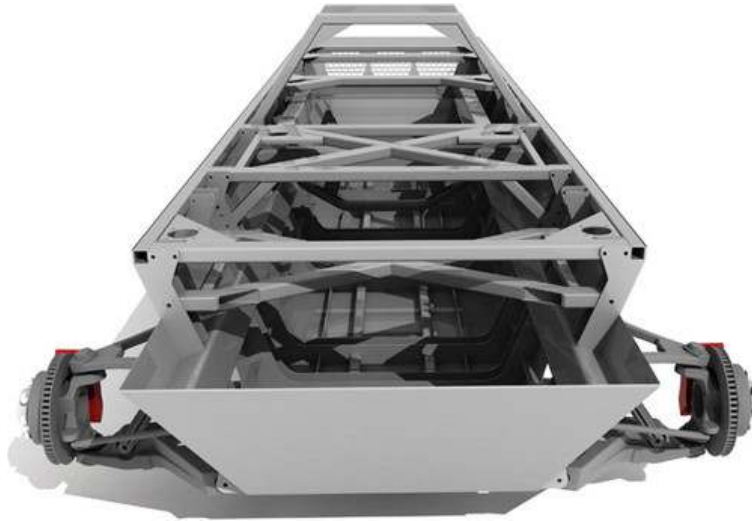
Chassi em aço inoxidável que abrigará as partes vitais do novo veículo TVM 6x6M. Notar os freios a disco ventilados de 300mm.

como transporte de tropas, cargas, ambulância, socorro, etc. Segundo o fabricante existem áreas de fácil acesso para manutenção e reparos nos componentes existentes no interior do chassi.