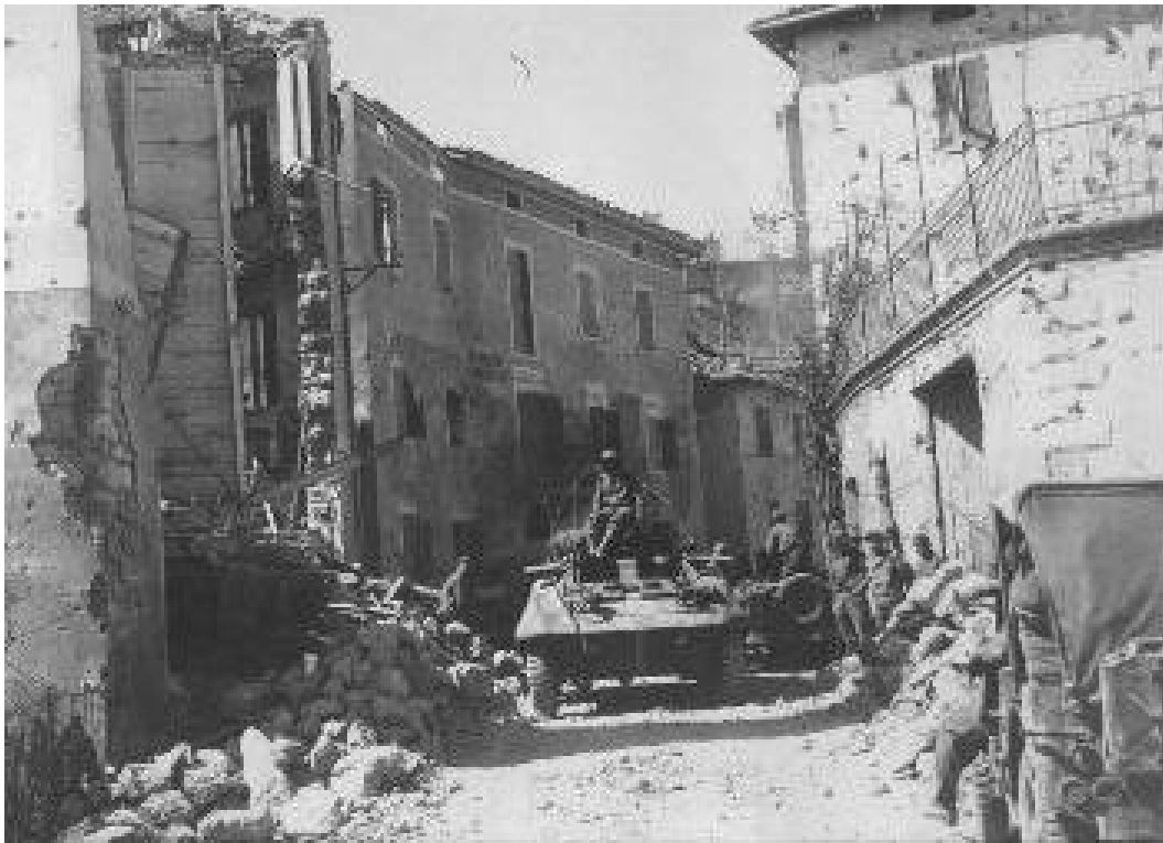
A foto mais clássica do Esquadrão de Reconhecimento entrando em Montese.

No lado direito abaixo do farol podemos ver uma caveira com dois raios pintados numa placa de madeira de fundo branco e os desenhos em vermelho, pois isto nada mais é do que um pedaço de uma placa alemã indicativa de cuidado mina, que foi recortada e usado pela tripulação para adornar o veículo. No centro entre as duas escotilhas podemos ver o número do carro, 18 em branco.