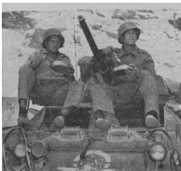
Uma pausa para o almoço. Notar o emblema brasileiro sobre o americano.

Já em outro veículo é possível ver na parte frontal o Cruzeiro do Sul entre os dois faróis e logo debaixo o resto de uma estrela branca, símbolo dos Estados Unidos, muito usado no teatro do pacífico, mas encontrado na Europa também.