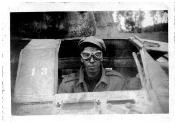
Detalhe da numeração dos M-8 usados na FEB. Este era o número do carro, nada tendo a ver com a matrícula norte americana. Na direção Cabo Álvaro.