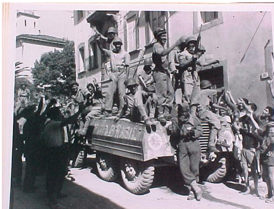
M-8 da FEB com a inscrição VIVA BRASIL em Camaiore. Os soldados confraternizam com a população italiana.

VIVA BRASIL (Escrito com giz ou algo parecido sobre o paralamas esquerdo quando estes adentravam em Camaiore).