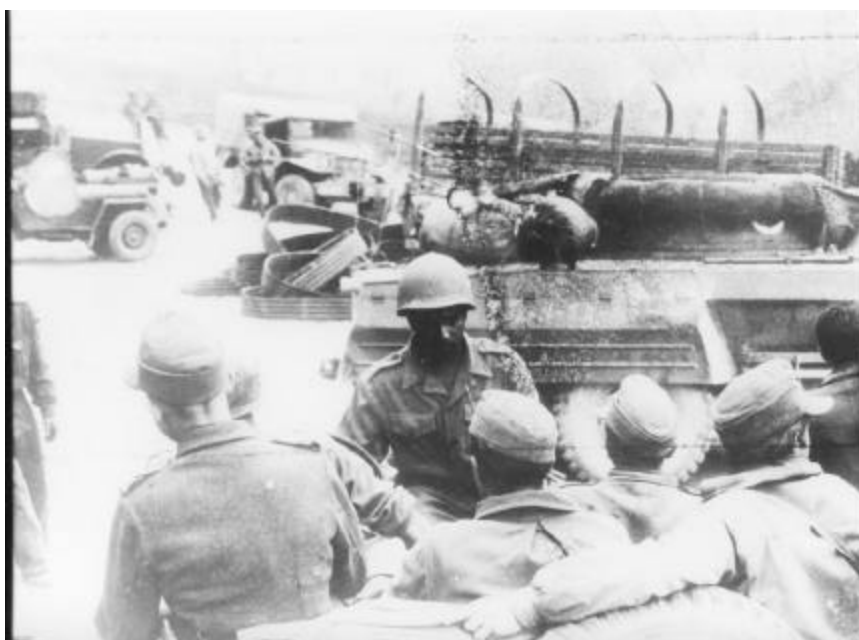
Rendição da 148 alemã em 1945. Notar a parte da torre e traseira do M-8 do 1º Esquadrão de Reconhecimento e um soldado brasileiro recebendo os alemães.

Poucos receberam o emblema primitivo do Esquadrão, um elmo sobre uma roda com pneu, símbolo da moto mecanização, sobre as lanças cruzadas com bandeirolas, da cavalaria, pintando em branco na lateral do veículo próximo ao paralamas dianteiro, que na maioria das vezes era retirado pois atrapalhava o seu desempenho no terreno lamacento, e dificultava a colocação de correntes no pneu para proporcionar uma melhor aderência ao solo.