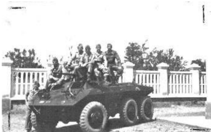
M-8 do 1º Esq. Rec. na Itália. Notar a falta da saias laterais, os emblemas frontais e o pedaço do emblema lateral entre as duas rodas traseiras.

Já em outro veículo é possível ver na parte frontal o Cruzeiro do Sul entre os dois faróis e logo debaixo o resto de uma estrela branca, símbolo dos Estados Unidos, muito usado no teatro do pacífico, mas encontrado na Europa também.