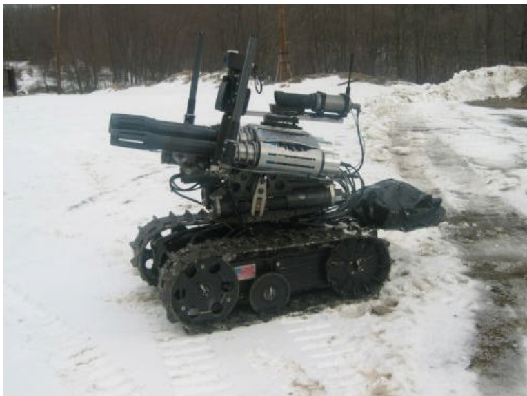
O veículo pronto para a demonstração.

Trata-se do METAL STORM 40mm , um pequeno veículo de controle remoto, sobre lagartas, armado com quatro canhões de 40mm, com alta cadência de tiro que foi demonstrando no polígono de testes de Picatinny, Nova Jersey onde realizou demonstrações reais contra vários tipos de alvos.