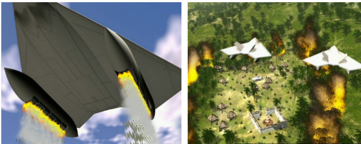
Concepção artística do futuro DP4X Libélula sem tripulação atacando base inimiga.

Junto a este veículo está também sendo desenvolvida uma plataforma área não tripulada, denominada DP4X Libélula (UAV) e que devido às suas dimensões, poderá sobrevoar a área inimiga, localizar os alvos e disparar uma quantidade de munições similares ao dos Metal Storm sobre as forças inimigas.