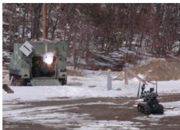
O veículo e dois de seus alvos – APC.

Este projeto é uma resposta do Exército Americano, que tenta minimizar para suas forças os temidos combates urbanos, fruto da experiência recente no Iraque, onde suas perdas já ultrapassam 1.500 homens, isto sem contar com a grande quantidade de equipamentos destruídos em ruas, avenidas e estradas na chamada guerra assimétrica que tanta preocupação e temor se vislumbra para este novo século há pouco iniciado.